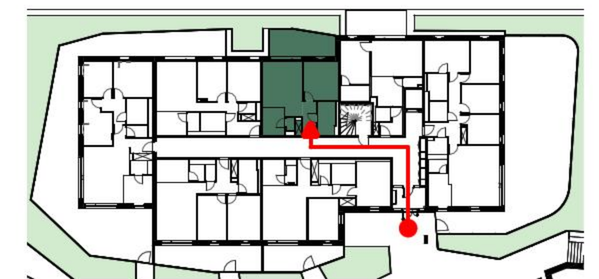
BAT 2 - APPT : 2-1-6 - R+1 - T2