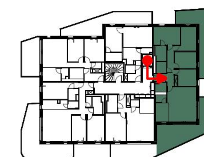
BAT 2 - APPT : 2-4-1 - R+4 - T5